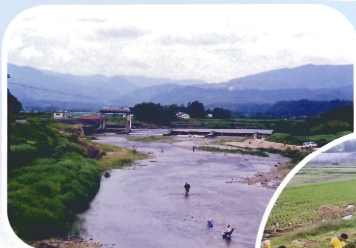
請戸頭首工(高瀬川)