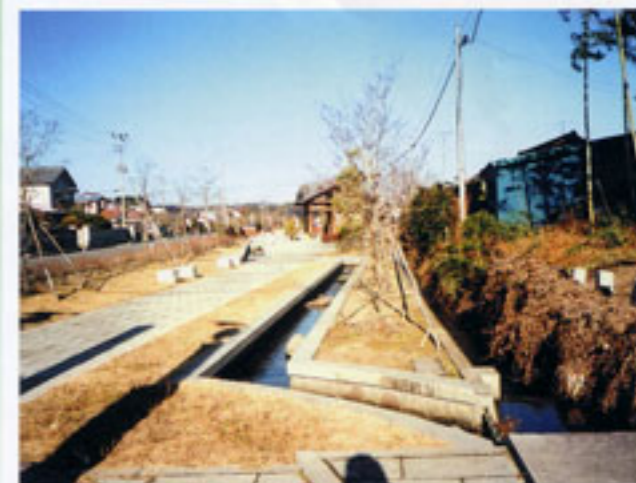
③吉名用水路を利用した公園