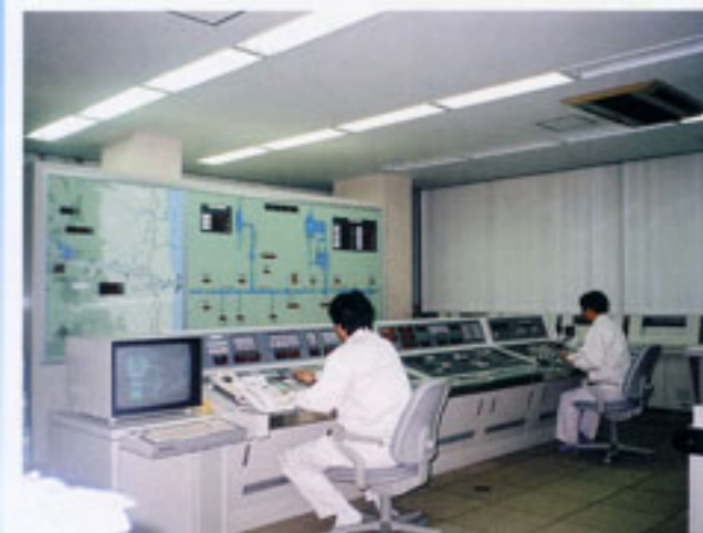
大柿ダム用水管理システム